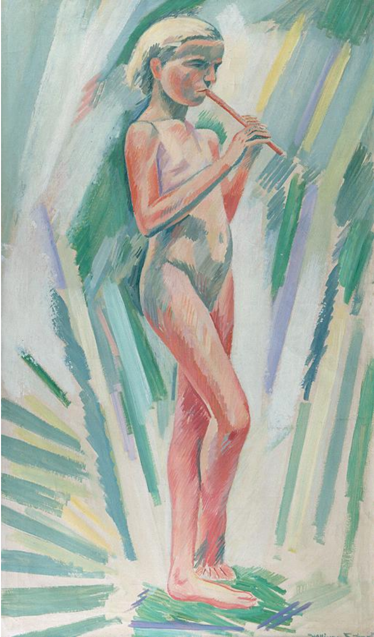
William Scharff: Dreng med pilefløjte, ca. 1950. Fuglsang Kunstmuseum