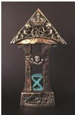
Mogens Leander: Portal

Passagerer betaler hver 20 kr. til chaufføren.