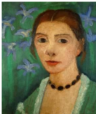
Paula Modersohn-Becker: Selvportræt. 1905