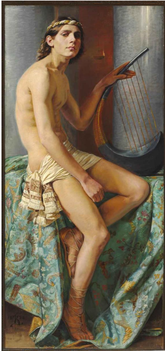
Kristian Zahrtmann: David ved Sauls palads, 1878. Privateje