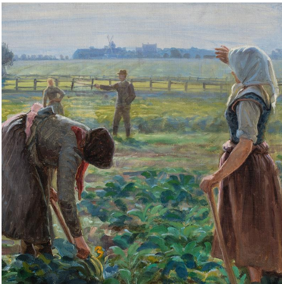
Johannes Wilhjelm: Polske roearbejdere i marken ved Øllingsøe på Lolland, ca. 1910. Fuglsang Kunstmuseum (detalje)