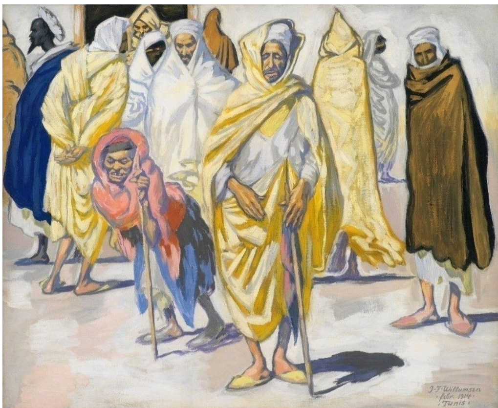
J.F. Willumsen: Arabere. Tiggerkvinden Votma (1914). SMK