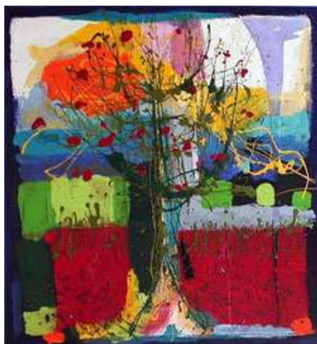
Et maleri fra serien Trees of Life