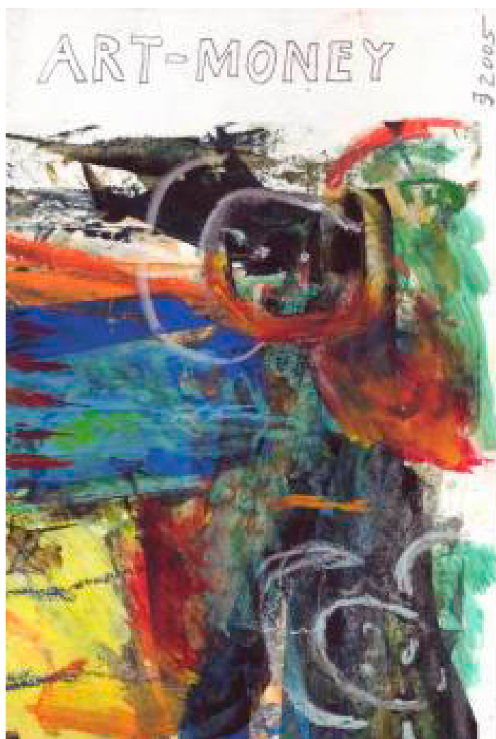
Jørgen Steinicke - Art-Money