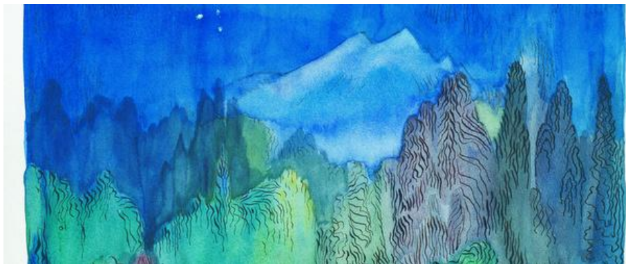
Margrethe II: "Fra serien" Landskaber til tabte sagn", 1976-1978