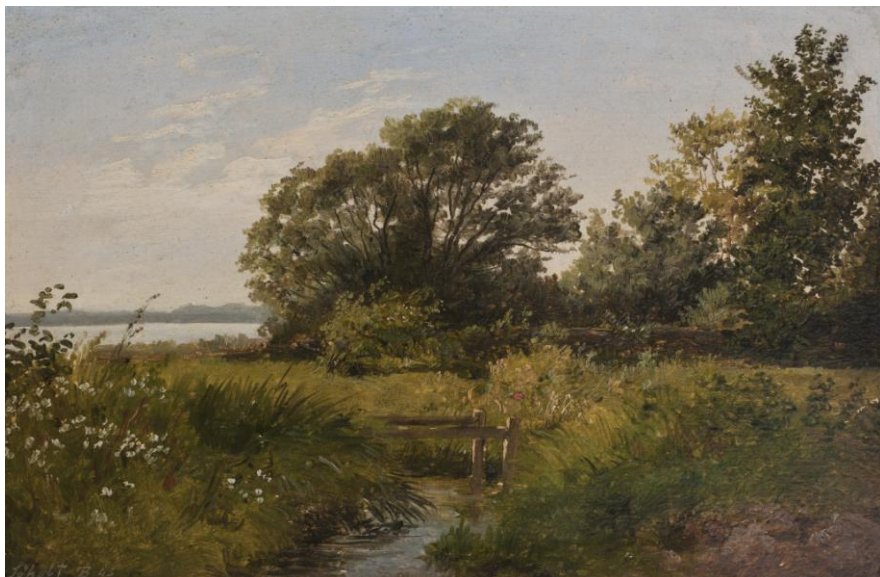
T. Brendstrup, Landskab ved Søholt, 1845. Olie på lærred, 19 x 26,7 cm. Privateje.

Onsdag den 25. april kl. 19.00 på Ribe Kunstmuseum