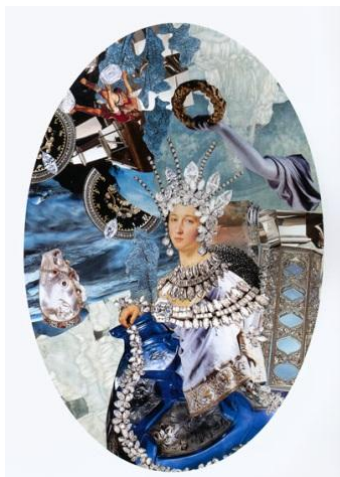
Margrethe II: Decoupage.

På Arken vises "Farvens sjæl". Udstillingen omfatter 135 arbejder af dronningen, både malerier og découpager.