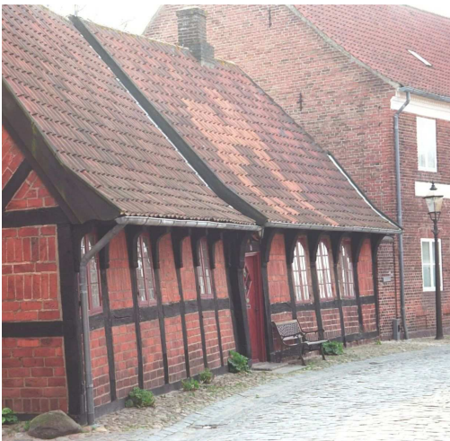
Puggaardsgade i Ribe