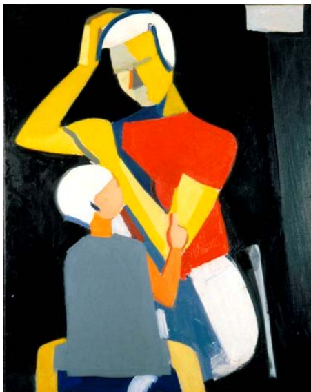
Mathiesen: Mor og barn, 1937