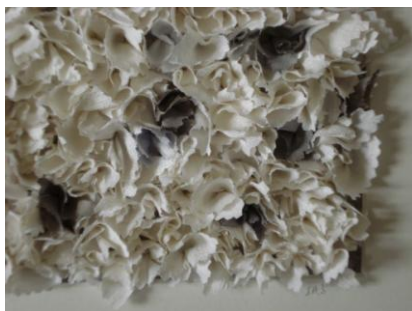
Inger Holst Sørensen: Iskrytaller (silke)