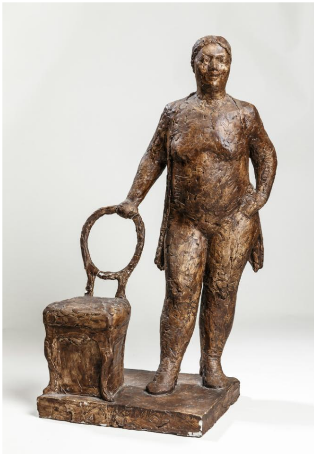
Hanne Varming: Nicole med stol. 1995. Bronze.