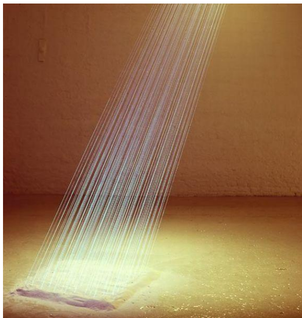
Steffen Tast: Solstråle. 1995.

Nylonsnøre, sand, el-pærer, UV-lvs, flouriserende maling