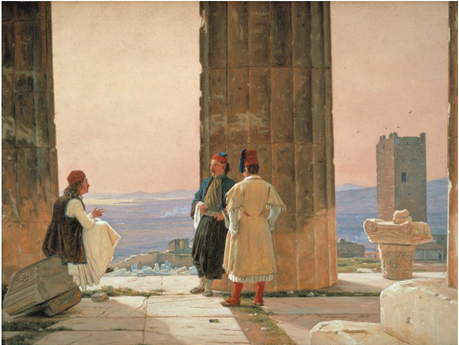
M. Rørbye: Udsigt fra Parthenon på Akropolis, Athen. 1844. SMK