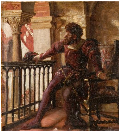
Kristian Zahrtmann: Chr. II ved Det Stockholmske Blodbad, 1875. 19x17 cm. RKM