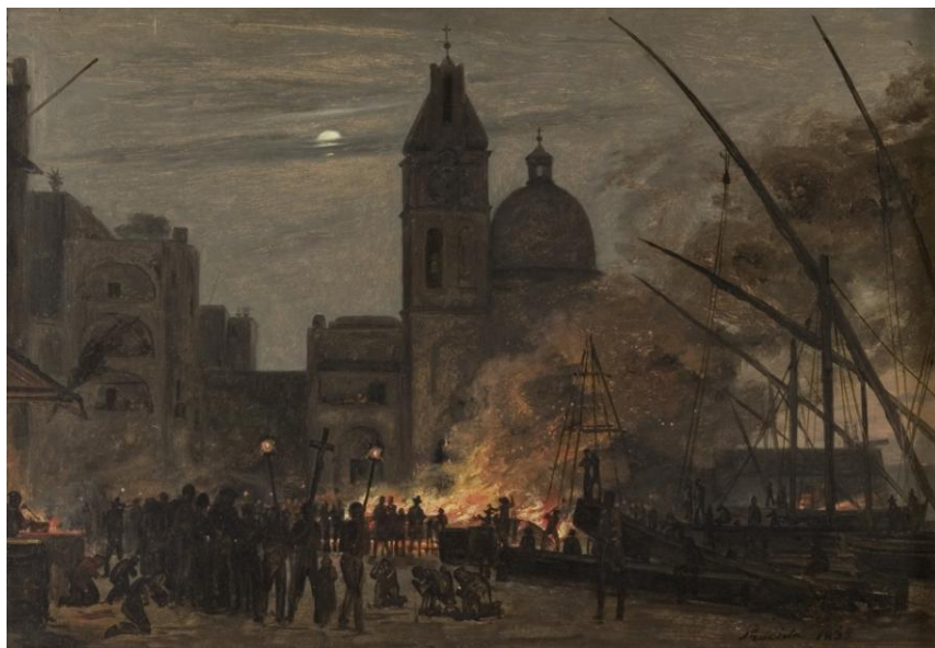
Martinus Rørbye: Et brændende skib. Scene fra Procidia, 1835. 29x42 cm. RKM