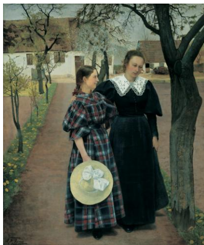
L.A Ring. Forår 1895. 190x159 cm. Den Hirschsprungske Samling