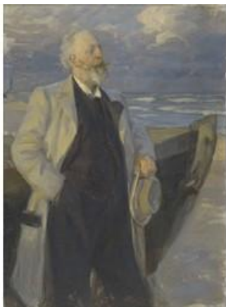
P.S. Krøyer: Portræt af digteren Holger Drachmann. 1895

Den Hirschsprungske Samling markerer sit 100 års jubilæum med århundredets Krøyer-begivenhed: "Krøyer i internationalt lys". Samlingens egne billeder og lån fra ind- og udland viser, at det store udland kendte ham, og at han ikke "bare" var Skagensmaler, men også hentede internationale strømninger til Danmark.