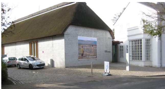
Føhr Kunstmuseum / Museum Kunst der Westküste

Mange har længe talt om at tage til Føhr, men er alligevel endnu ikke kommet af sted. Nu har vi chancen!