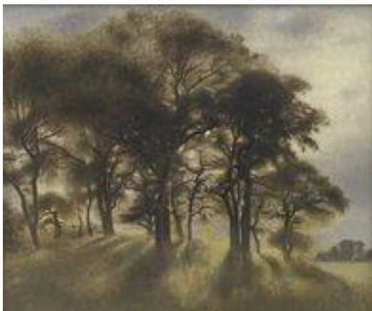
Vilhelm Hammershøi: Fra Fortunen. 1901