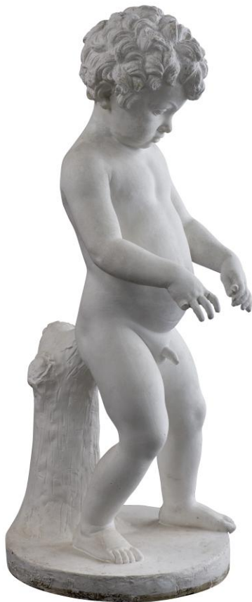
August Saabye: Stående barn, 1867. RKM