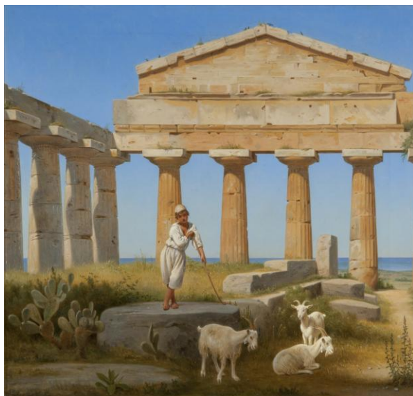
Constantin Hansen: Cerestemplet i Pæstum. 1841. RKM