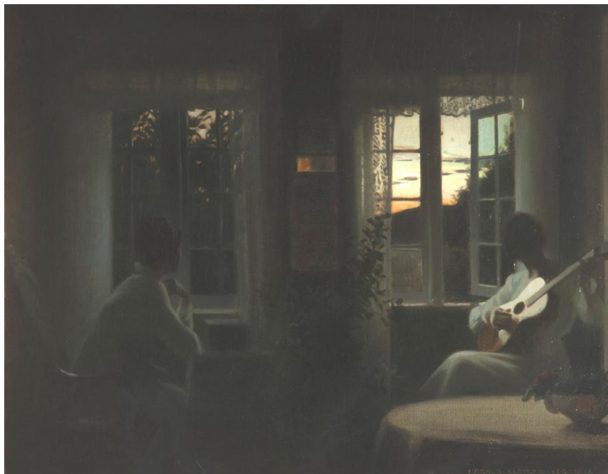
Harald Slott-Møller: Skumring, 1918.

Harald Slott-Møller foretager landskabsstudier gennem hele sin karriere. Særligt optaget er han af at skildre naturens særpræg, dens iboende kraft og stemningsmættede udtryk - fra det fortrolige og hverdagsagtige til det gådefulde og oversanselige. I det lukkede vindue til venstre i billedet ses en fortættet og spirende natur på klods hold. Naturen i det åbne vindue til højre åbner sig derimod - til udsigt til en fjern bakketop, små sommerskyer og en farvemættet solnedgang.