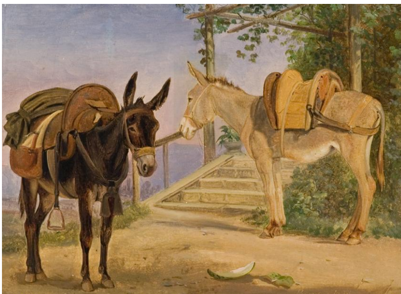
Jørgen Sonne: To æsler. 1839. RKM

NB. Særpris for folkepensionister: 110 kr. Beløbet overføres til vores konto i Sydbank: 7701-0150605 (husk kursusnavn).