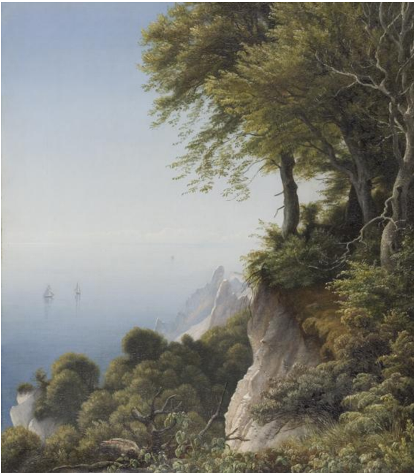
P.C. Skovgaard: Møens Klint, 1852-53.