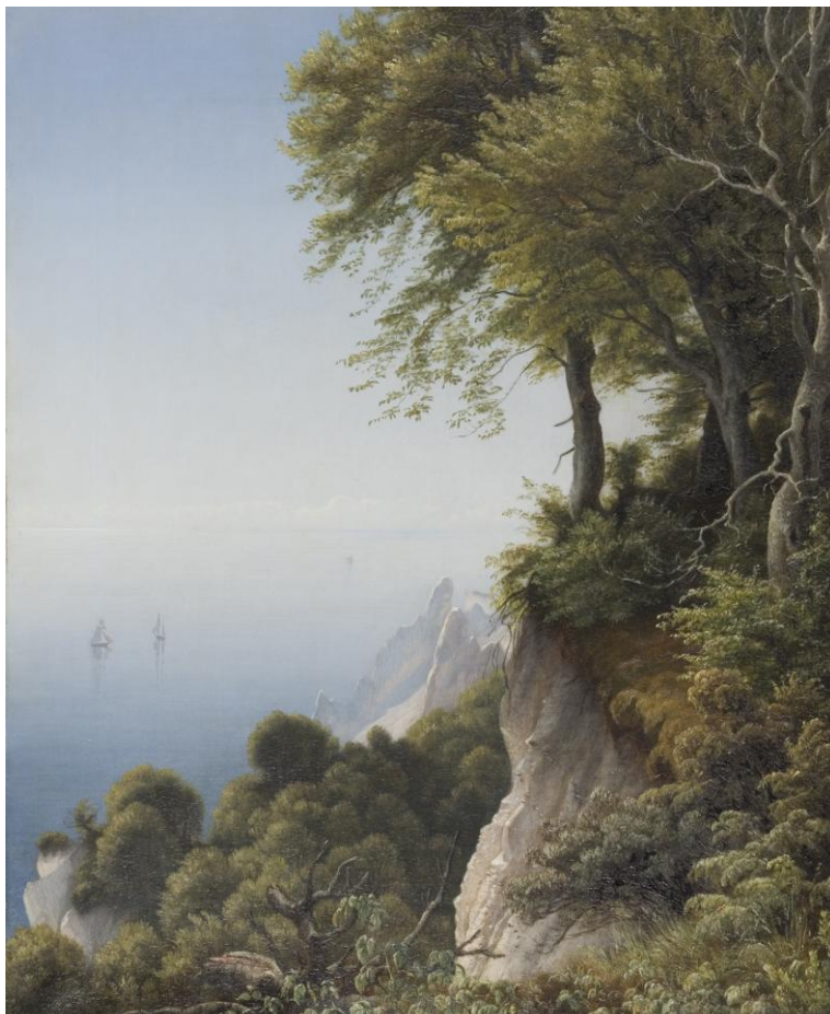
P.C. Skovgaard: Møens Klint, 1852-53. Ribe Kunstmuseum