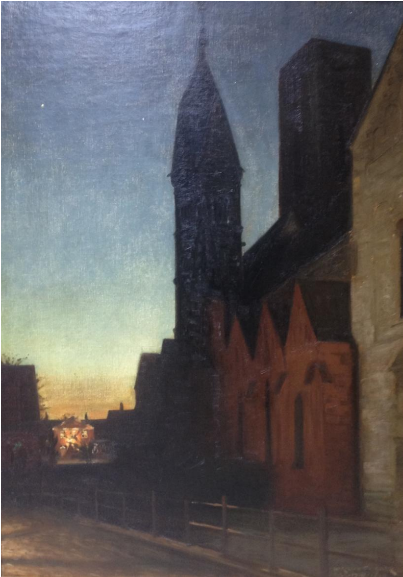
Harald Slott-Møller: Aften. Ribe, 1909. Ribe Kunstmuseum