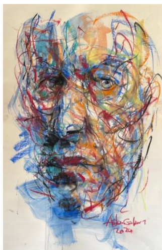
Adam Gabriel, Oliepastel på papir, 84x58 cm

Udloddes på den kommende generalforsamling