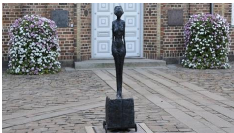
"Kvinde på kærre", Alberto Giacometti, Holstebro