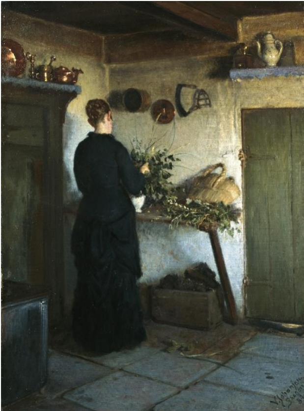
Viggo Johansen: Køkkeninteriør , 1884, Skagens Kunstmuseer