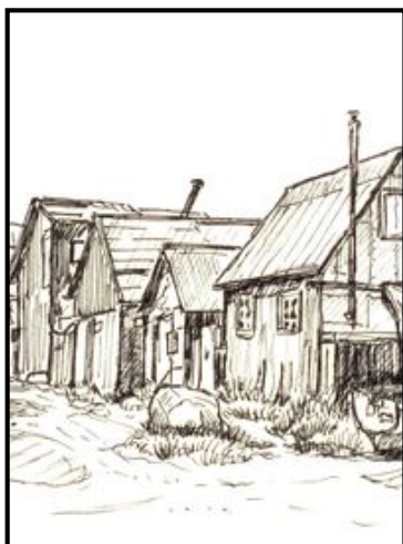
Povl-Otto Nissen Autodidakt billedkunstner