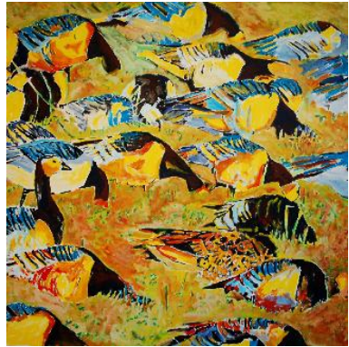
"Gæs over marsken" Else Pia Erz