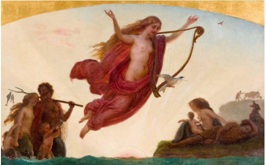
Lorenz Frølich: Dagen. Morgenrøde