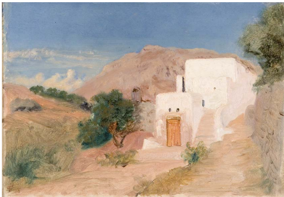
Lorenz Frølich: Hvidt hus ved Neapel