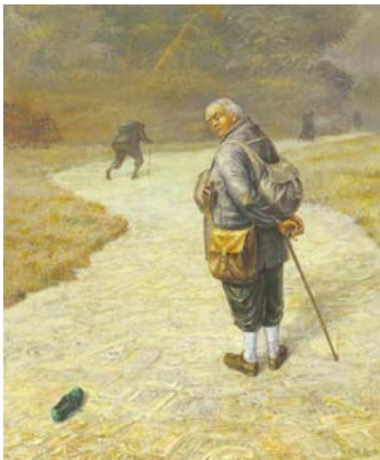
"Den grønne sko" Otto Frello