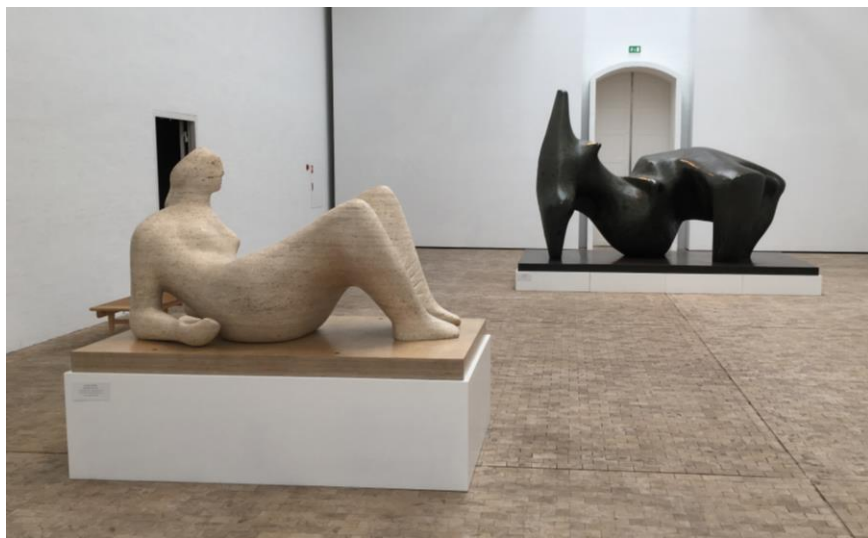
Henry Moore på Tønder Kunstmuseum

Kunstmuseet i Tønder har fået en enestående mulighed for at vise et bredt udvalg af Henry Moores værker på en særudstilling, der har fået navnet " Henry Moore – grænser til Norden ". I et samspil med centrale dele af museets samling af nordisk kunst fra 1940 og til i dag kan man opleve, hvordan den nordiske kunst og Henry Moore har mere til fælles, end man umiddelbart skulle tro. Nolde Museet fejrer, at det i år er 150 år siden, Emil Nolde blev født. Samtidig vises udstillingen " Emil Nolde trifft Henry Moore ". I haven er der opstillet monumentale skulpturer af den verdensberømte britiske billedhugger.