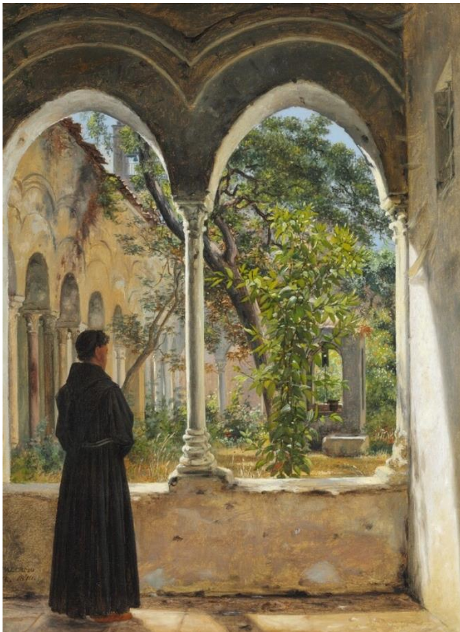
M. Rørbye: Klostergang i Palermo med franciskanermunk, 1840. RKM