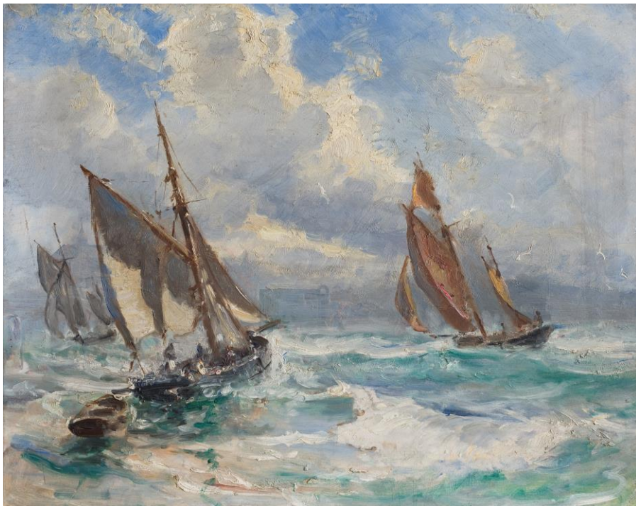
Holger Drachmann: Fiskerbåde i stormvejr. U.å. RKM deponering.