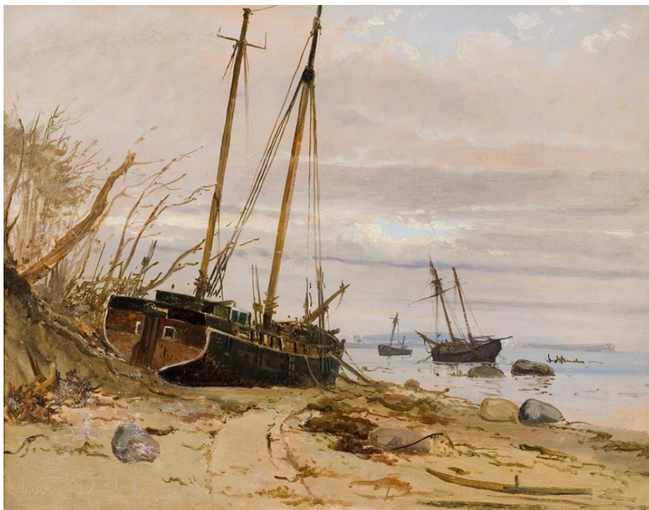
Holger Drachmann: Fra stormfloden 1872. Falster 1872. RKM

Nu er alle aftaler til Skagensturen på plads. 35 deltagere har tilmeldt sig.