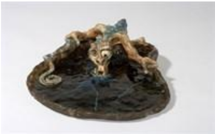
Trolden, der suger søen ud, 1888. Skovgaard Museet