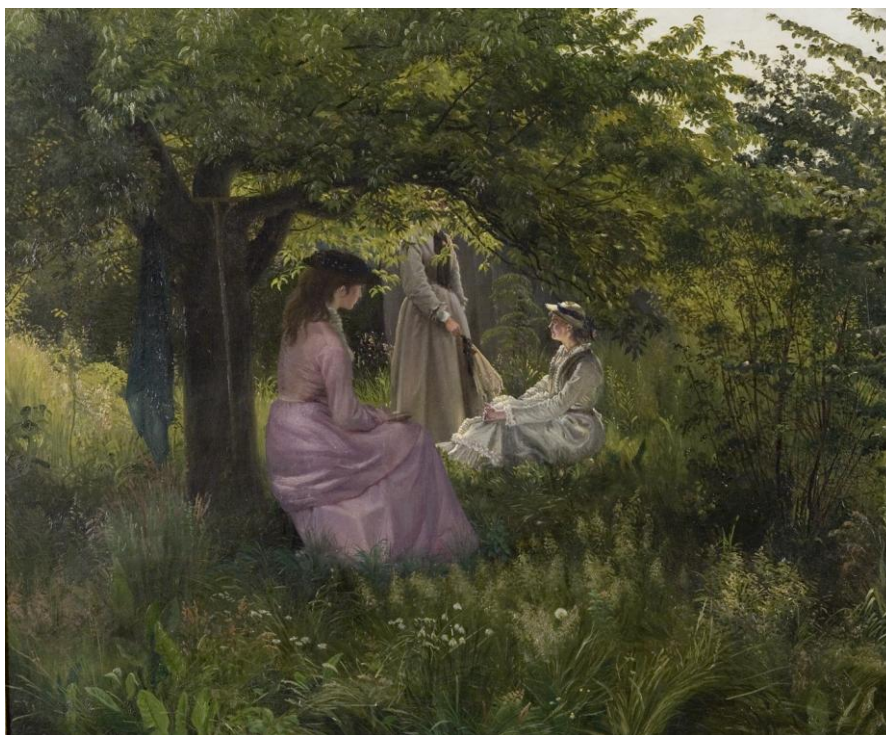
V. Kyhn: Tre damer i en have, 1879. Ribe Kunstmuseum