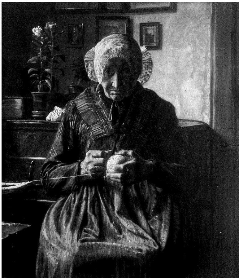
Kr. Zahrtmann: En Ribekone. Statens Museum for Kunst

I sidste nummer af medlemsbladet blev museets nyligt erhvervede maleri af en gammel kone fra Ribe præsenteret. Hvem denne kvinde var, som Kristian Zahrtmann (1843-1917) med så megen indlevelse og hjertelighed har portrætteret i 1875, ville museet gerne finde ud af, og højest sandsynligt er gåden nu løst.