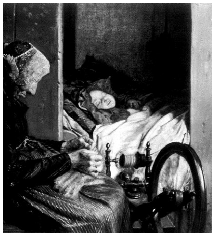
Kr. Zahrtmann: Bedstemoder med sit barnebarn, 1875. SMK

Jan Gorm Madsen, museumsinspektør, mag.art.