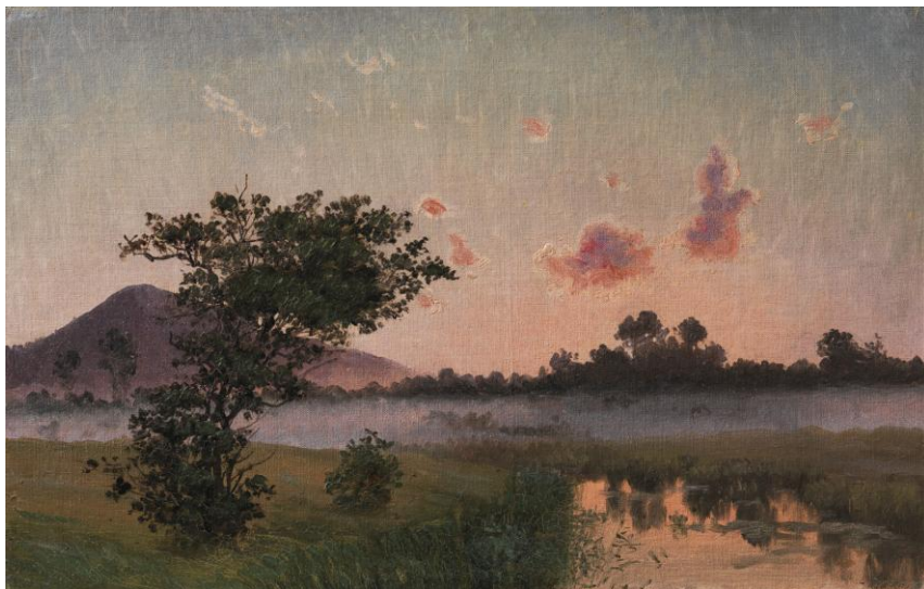
V. Kyhn: Sommeraften ved Ry, 1873. Statens Museum for Kunst

For yderligere oplysninger se www.ribekunstmuseum.dk