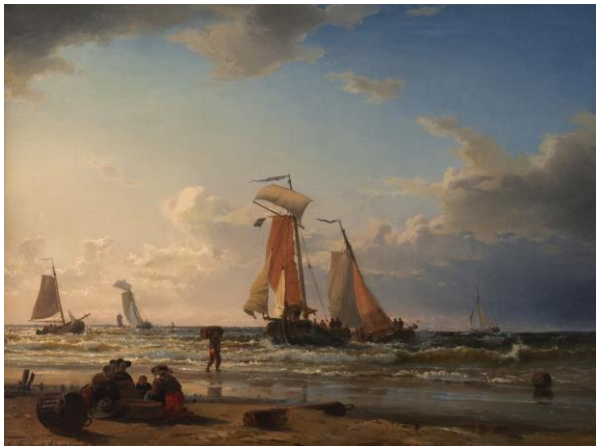
C.F.Sørensen: Kystparti med personer. RKM

C.F. Sørensen (1818-1879) er en af vores største marinemalere. Han blev født på Samsø, men drog efter konfirmationen til København, hvor han blev indskrevet på Kunstakademiet. Sørensen rejste til Middelhavet og Madeira, til Island og Færøerne – sidstnævnte sammen med Chr. IX – og tog næsten hvert år ud med orlogsskibe rundt omkring i Europa.