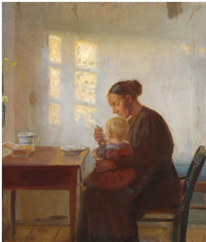
Anna Ancher: En mor med sit barn i en sollys stue. Ca. 1905. RKM