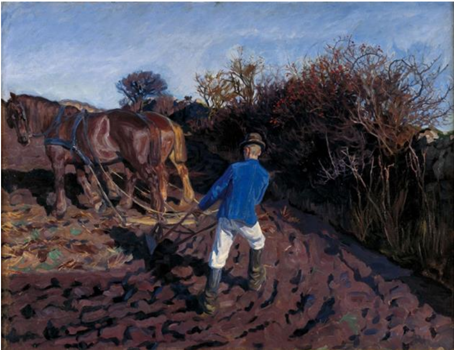
Peter Hansen: Pløjemanden vender. 1900-02. Faaborg Museum

Til oktober slår vi på Ribe Kunstmuseum dørene op til en ny, spændende udstilling. Jordforbindelser – dansk maleri 1780-1920 og det antropocæne landskab diskuterer et af vor tids vigtigste og mest akutte spørgsmål på en helt ny måde: historisk kunst og geografisk udkant mødes og giver klimaspørgsmålet en jordforbindelse, der kan kvalificere refleksion, debat og handling. Det antropocæne landskab – det menneskeskabte landskab – har vundet frem i Danmark gennem de sidste 200 år. Udviklingen tog for alvor fart i 1800-tallet, hvor vi fik ny viden om landskabets historie, hvor alle dele af landet blev kortlagt og landbruget effektiviseret.