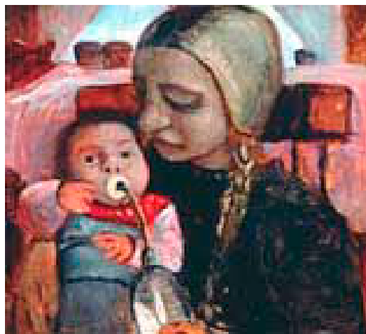
Paula Modersohn-Becker, Mädchen mit Säugling