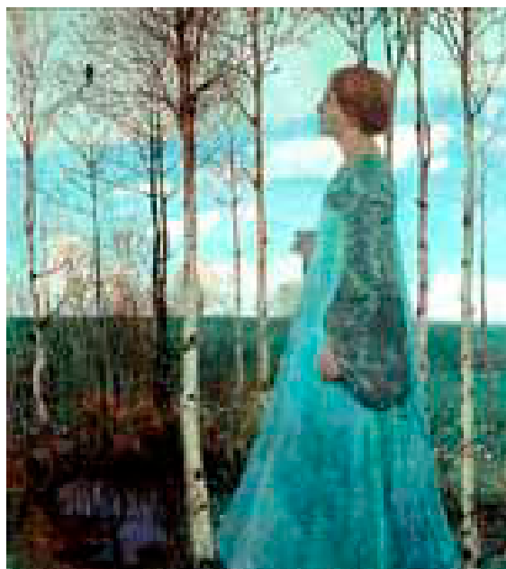
Heinrich Vogeler, Frühling, 1897

Beløbet kan også betales på giro nr. 808-0135 (gruppe 01) - HUSK da, at de oplysninger, der spørges om på tilmeldingsblanketten, skal stå på girokortet.