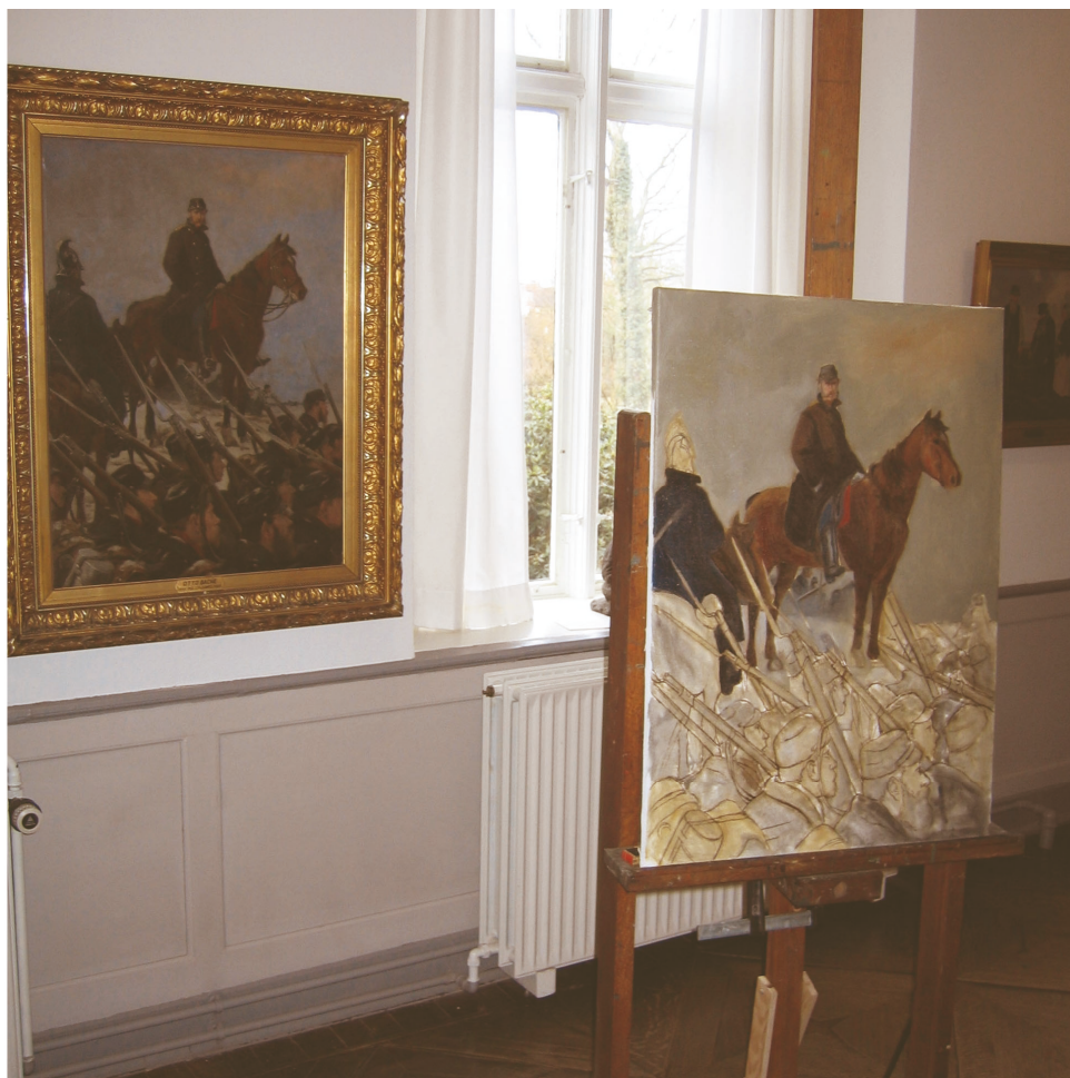
Hvad med en god historie? En udstilling for børn