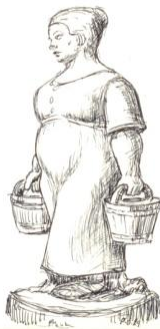
Pennetegning af Povl-Otto Nissen