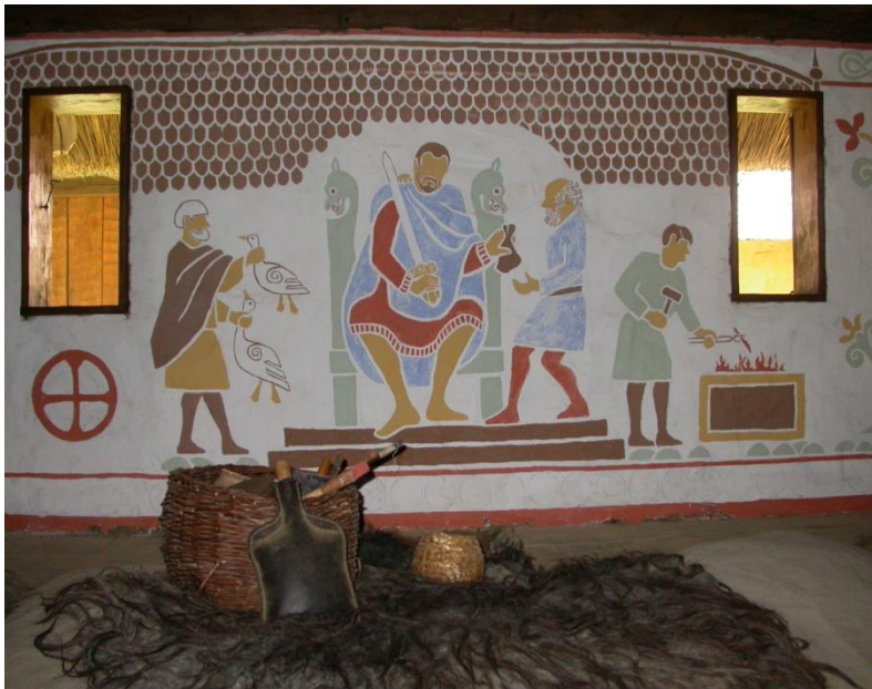
Trine Theut, VikingCentret Lustrupholm, 2010