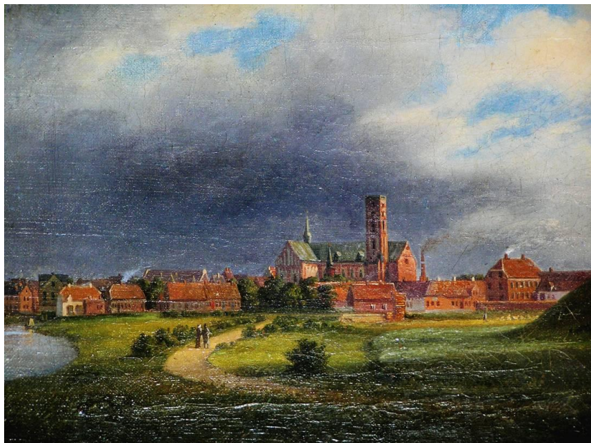
Foreningens gave til museet.

Med denne gave, som forbinder fortid og nutid, vil Ribe Kunstforening sige tillykke til Ribe Kunstmuseum med foryngelsen og forskønnelsen. Tak til dem, som har betalt gildet (deres navne er nævnt så ofte); sidst, men ikke mindst: tillykke til os selv, til byen, til kommunen og hele egnen med det nye slot i Vesterled.