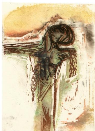
Peter Brandes: Træsnit