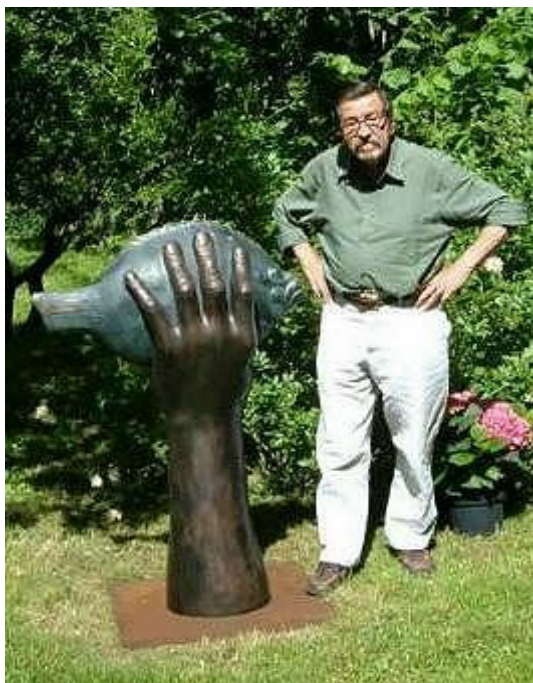
Günter Grass ved én af sine bronzeskulpturer

Tilmelding med oplysning, om man kan have passage- rer/ønsker at være passager til Lene Beck tlf. nr. 7475 3650 el- ler lenbec@sol.dk senest 13. september (er bortrejst i uge 33)