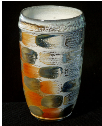
Sten Børsting Vase