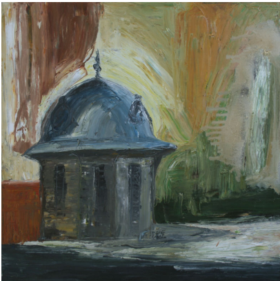
Lars Bollerslev Pavillonen i museumshaven