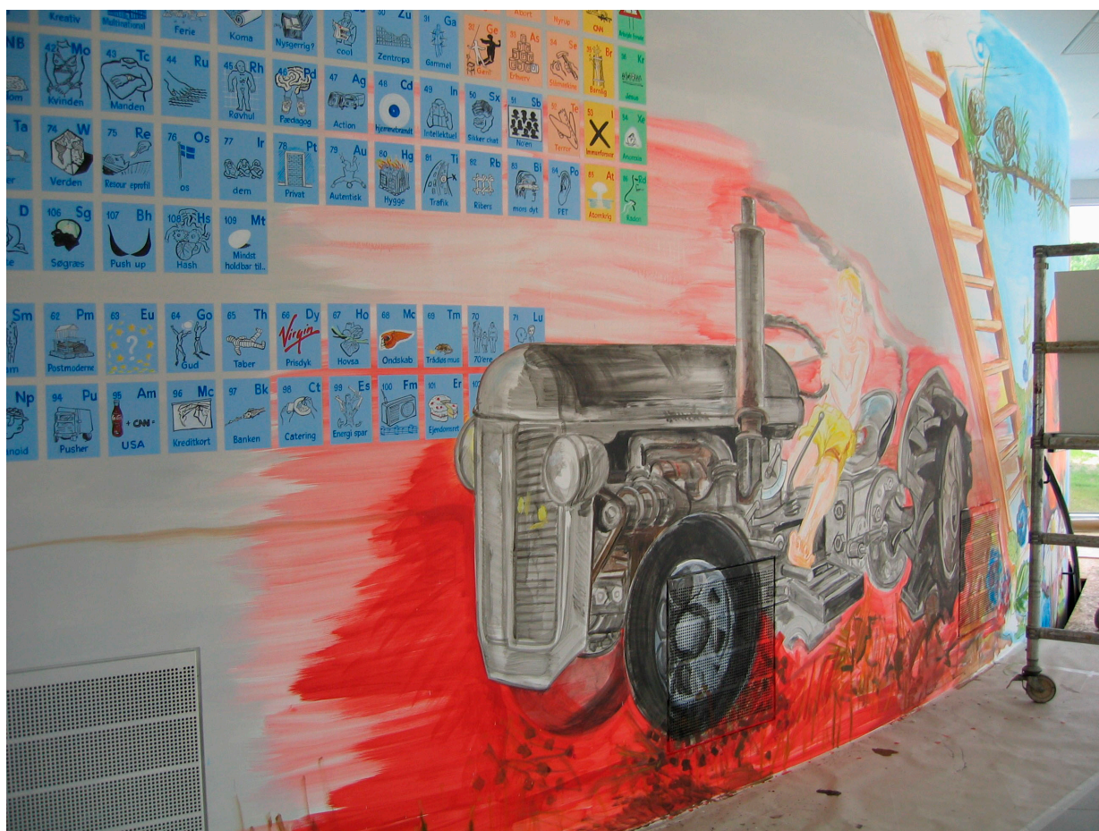
Udsnit af Esbjerg-evangeliet på Esbjerg CVU-Vests rotunde

og SENEST 8 DAGE før de enkelte arrangementer (somme tider vil tilmelding dog være nødvendig tidligere. Det vil i så fald være anført ved arrangementsbeskrivelsen).