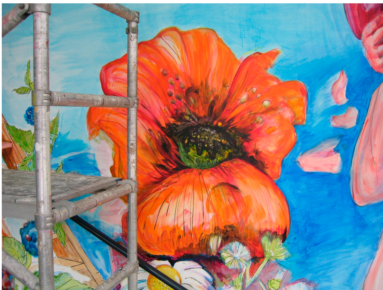
Udsnit af Esbjerg-evangeliet på Esbjerg CVU-Vests rotunde