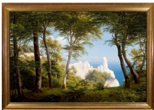
P.C. Skovgaard: Udsigt over havet fra Møns Klint, 1850.