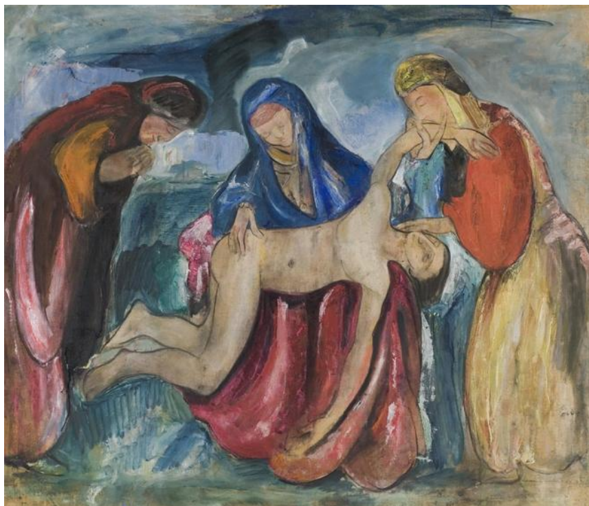
J.A. Jerichau: Pietà. u.å.

Udstillingens sidste dag er søndag d. 4. september 2011.