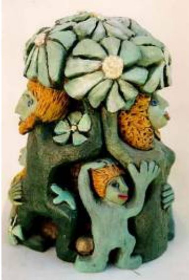
Keramisk skulptur – Kirsten Svenstrup