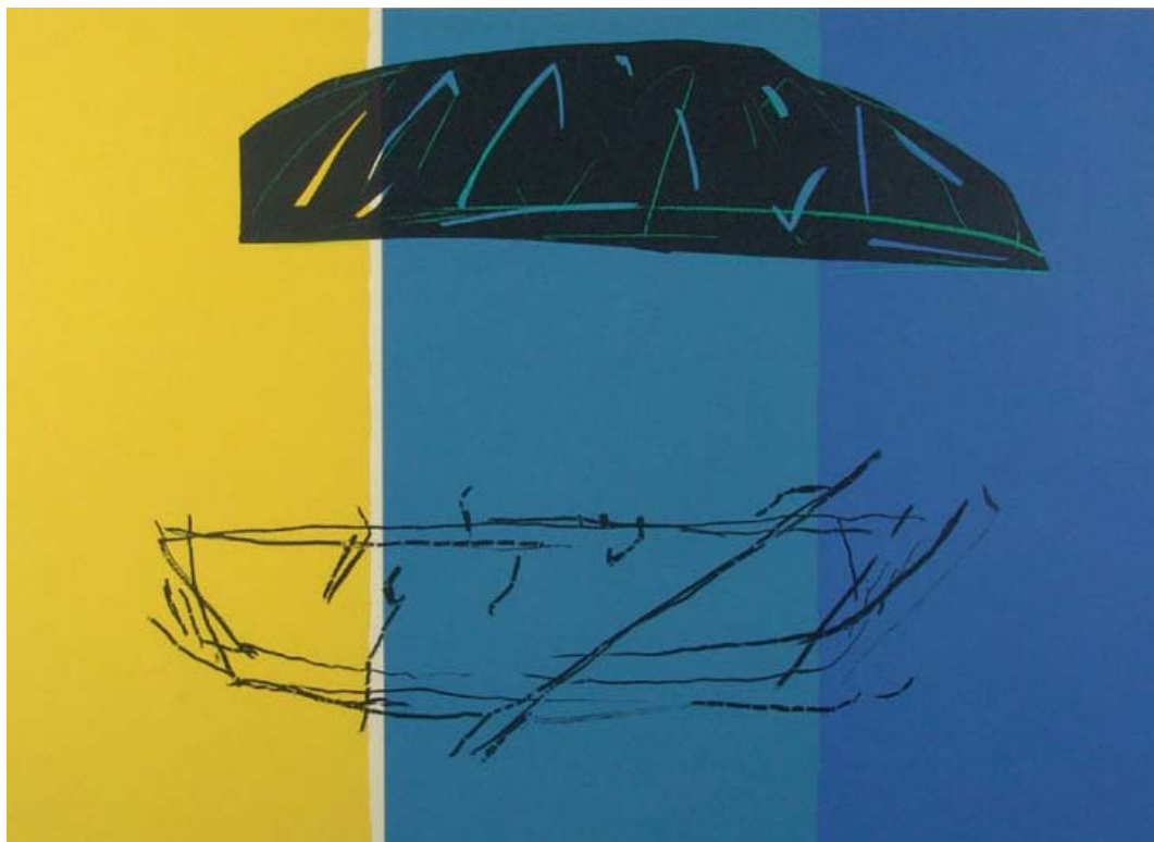
Maleri af Kjell Nupen

Nyt logo, ny hjemmeside og nyt layout af medlemsbladet