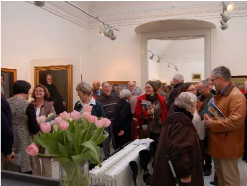
Der var fuldt hus ved ferniseringen