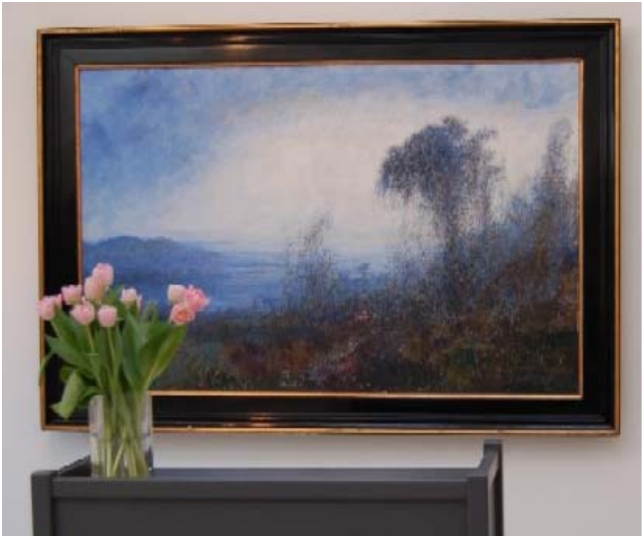
Det blå maleri er malet af Pauline Thomsen, 1929

"Kunst er: Et eller andet ungt menneske går hen på et kunstmuseum og ser et eller andet billede og derefter er hans liv forandret. Det er kunst. Den der rystende eksistentielle oplevelse, som man kan være heldig at rende ind i hvert skudår. Det giver et mægtigt drøn i tilværelsen."