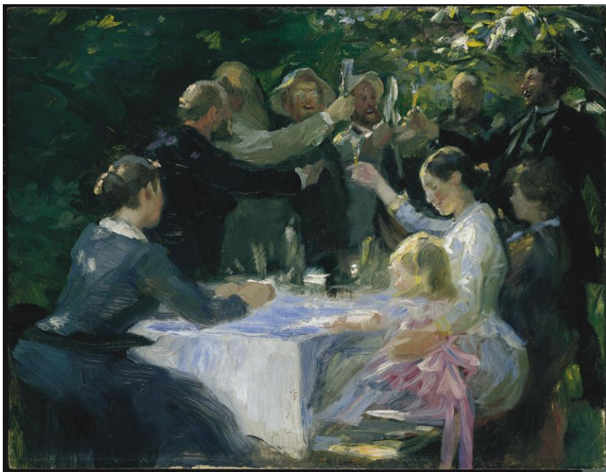
Krøyer: "Hip Hip hurra". Tilhører Skagens Museum.