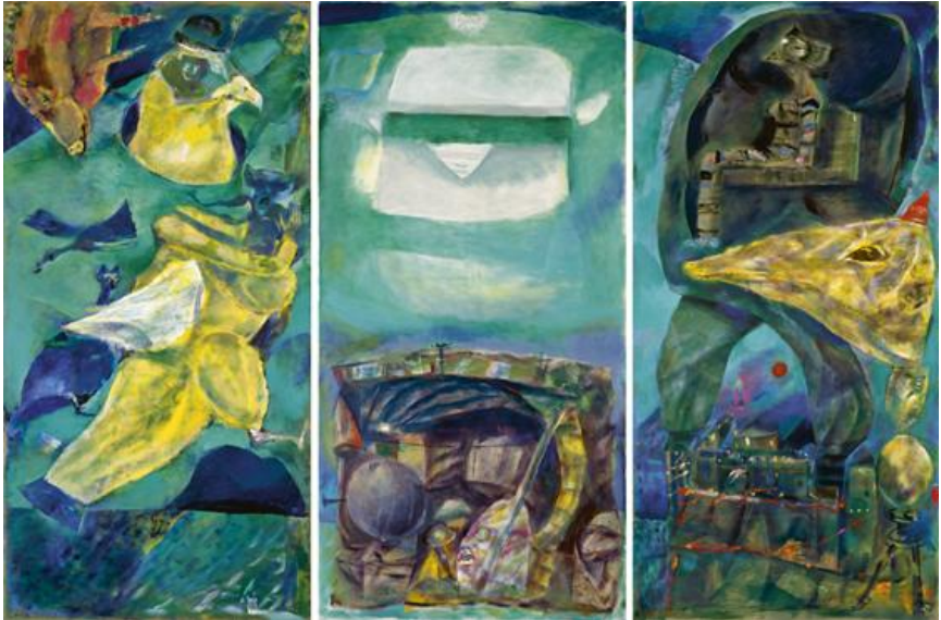
Emil Wachter: "Multimedi". 2000. Triptykon

Kl. 9.45: Mødetidspunkt, betaling af turen samt fordeling i privatbiler