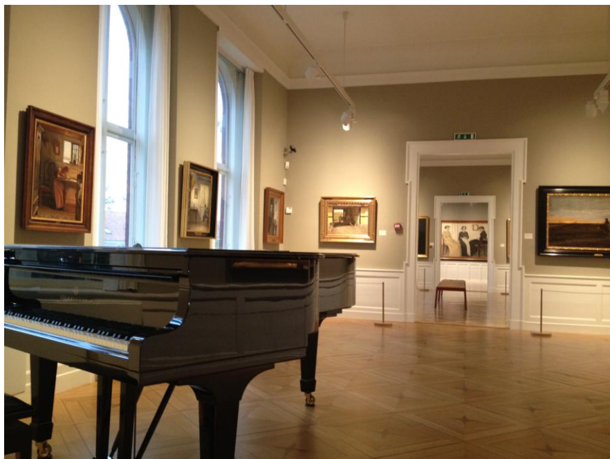
Steinway flygel på Ribe Kunstmuseum

Et længe næret ønske hos undertegnede har været at få anskaffet et rigtig godt flygel til kunstmuseet. Det er nu lykkedes, idet en privat har deponeret sit Steinway-flygel på museet for en længere periode. Det er et pragtfuldt instrument, som klinger særdeles godt i de smukke sale. På kulturnatten blev det for første gang taget i brug til glæde for rigtig mange. Der er udsigt til mange gode koncerter med et så fornemt instrument i huset.