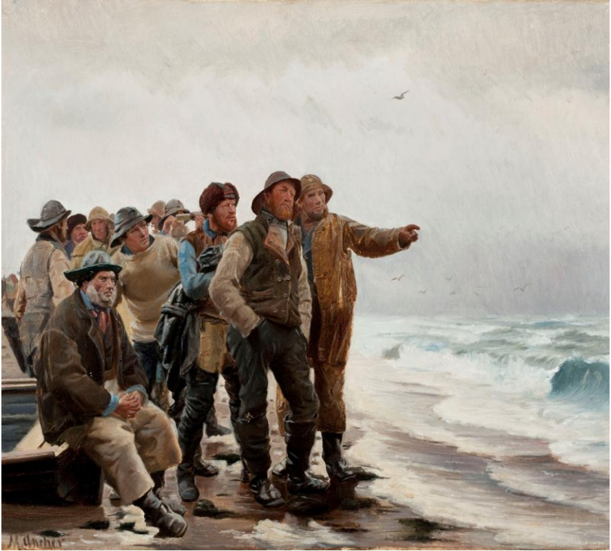
Michael Ancher: "Vil han klare pynten". Tilhører Skagens Museum.

For at kunne få skiftet udstillinger og ordnet gulve holder museet lukket i dagene 7. – 11. januar 2013.