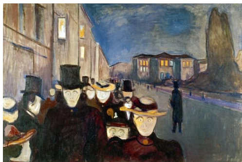
Edvard Munch: "Aften på Karl Johan". 1892.

Pris: medlemmer 400 kr. – ikke medlemmer 500 kr.