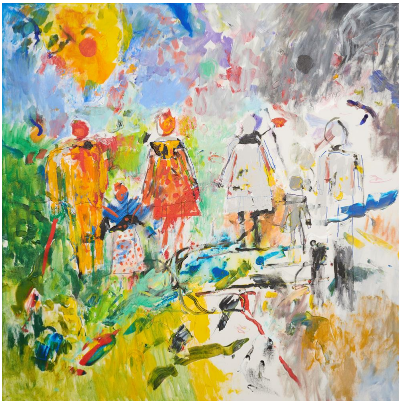
Hans Tyrrestrup: The Global Goals no. 10