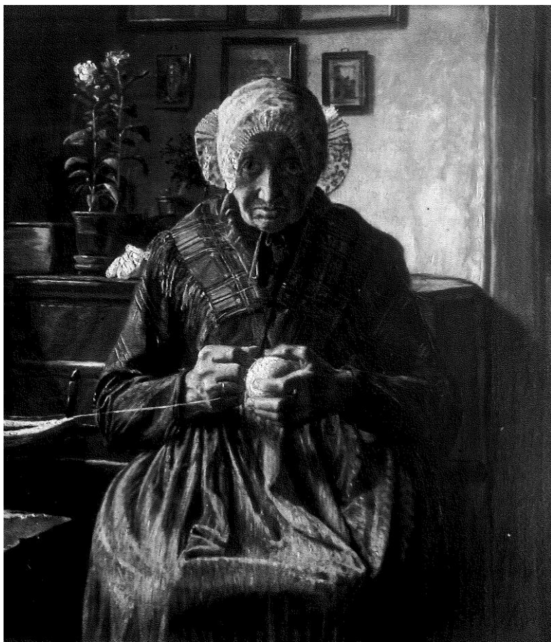
Kr. Zahrtmann: En Ribekone. Statens Museum for Kunst

I sidste nummer af medlemsbladet blev museets nyligt erhvervede maleri af en gammel kone fra Ribe præsenteret. Hvem denne kvinde var, som Kristian Zahrtmann (1843-1917) med så megen indlevelse og hjertelighed har portrætteret i 1875, ville museet gerne finde ud af, og højest sandsynligt er gåden nu løst.