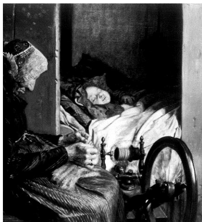
Kr. Zahrtmann: Bedstemoder med sit barnebarn, 1875. SMK

Jan Gorm Madsen, museumsinspektør, mag.art.