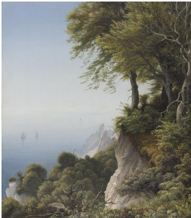
P.C. Skovgaard: Møens Klint, 1852-53. RKM