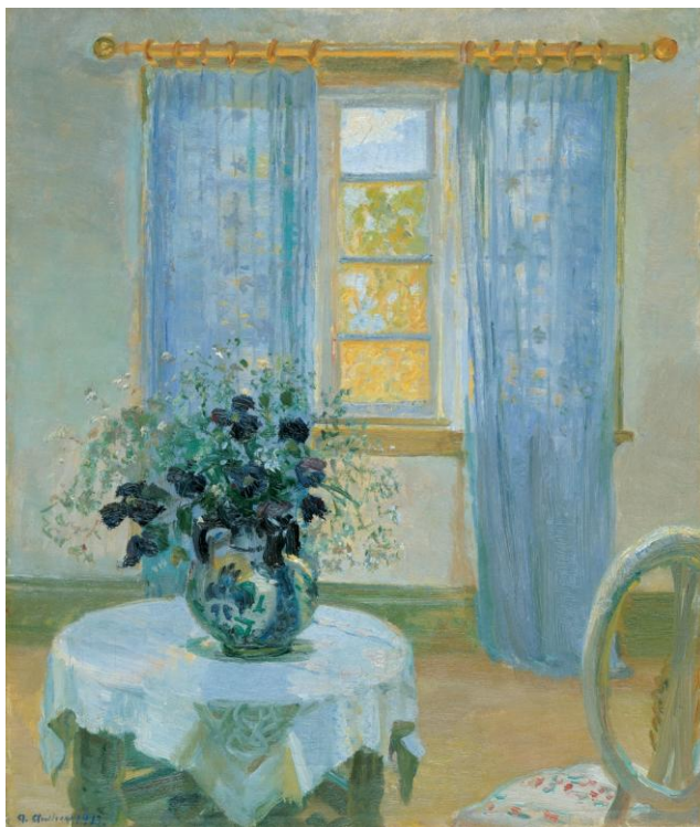
Anna Ancher: Interiør med klematis, 1913. Skagens Museum

Det er endnu uvist, hvornår værkerne ankommer, men formodentlig ca. 1. oktober. Det vil blive offentliggjort i dagspressen, når man kan se disse dejlige værker i Ribe. Der bliver ikke arrangeret en udstillingsåbning, da der ikke er tale om en større særudstilling, men om en ophængning af 9 værker fra Skagen sammen med museets egen samling i stueetagen.