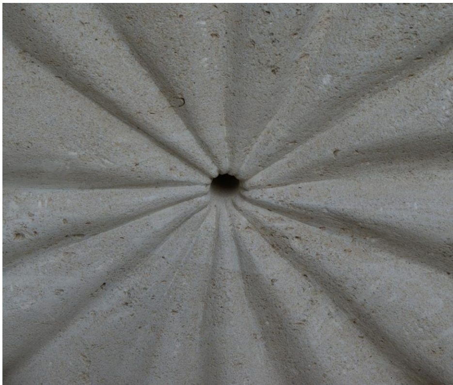
Lars Waldemar: Skulptur i marmor, 2014 (udsnit)