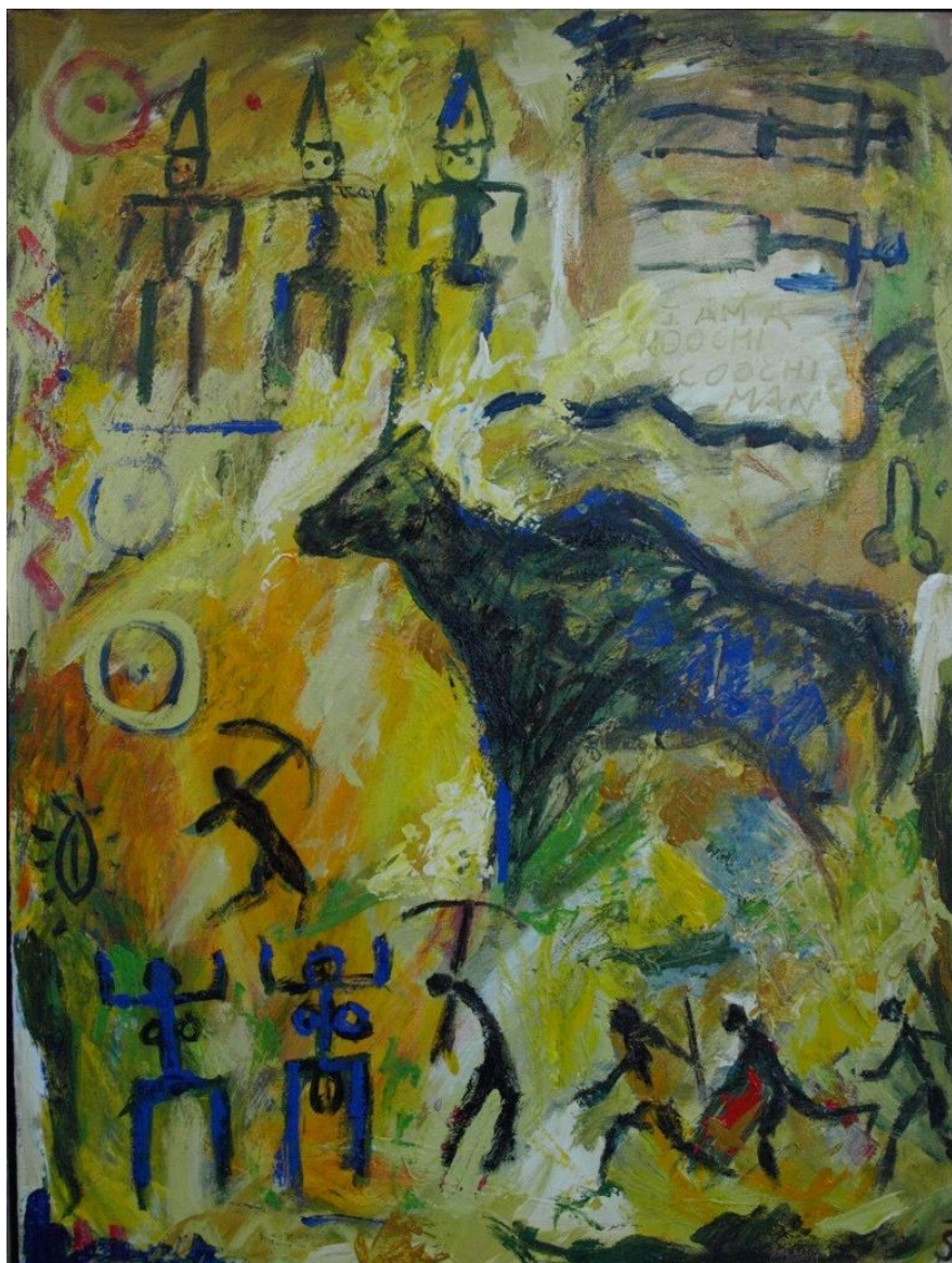
Jørgen Steinicke: Roadrunner – fra serien Blues, 2008 (privateje)