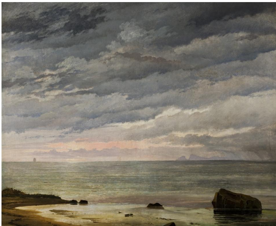
J.Th. Lundbye: Den opgående sol over havet. 1838. Ribe Kunstmuseum