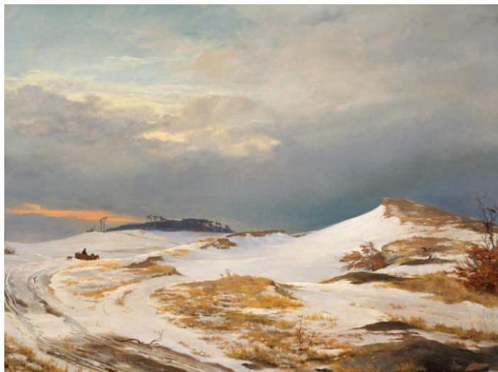
J.Th.Lundbye: Vinterbillede i nordsjællandsk karakter. 1841 Nivaagaards Malerisamling

PS. Beretning, regnskab og referat ligger på vores hjemmeside.